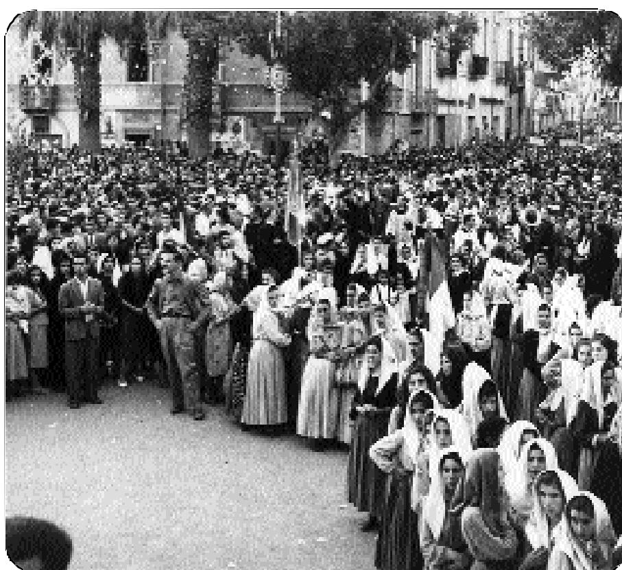
Oristano, 7 settembre 1951: La folla dei fedeli presenti in piazza Roma all'incoronazione del simulacro di N.S. del Rimedio.

da quella dell'astuzia, il suo frutto gli verrà offerto "dodici volte all'anno" (cf Ap 22,1-2,14), ma sarà come dono e come conquista di fedeltà e non di competizione. Domanda finale: il racconto del giardino è davvero il racconto di una "caduta" e di un "allontanamento"? o non è forse meglio il racconto di come "stare in piedi" e come "avvicinarsi" a Dio, ai propri simili, agli animali, e a tutto il creato?